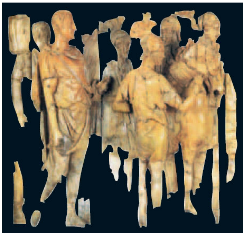
Abb. 37: Elfenbeinfries aus Ephesos. Malerei von Angi Delrey nach dem Original aus Selçuk, Türkei, Efes Müzesi.

mun/tiorum et Lepontiorum procur(atori)/ provinc(iae) Iudaeae proc(uratori) provinc(iae)/Bel-gicae/Mari Cethegi corni(cularii?) piiss(imi?) frat-res.