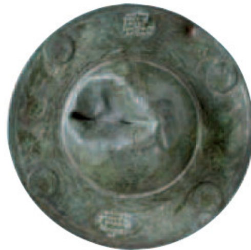
Abb. 39 und 40: Schildbuckel eines equites singulares augusti und die dazugehörige Umzeichnung. Der Text ist lateinisch in griechischen Buchstaben geschrieben. MAPKOS OYLTTIOS EKYES CINGLAPIS AYCOUSTO(Y) Marcus Ulpus equ(es) sing(ularis) Augusti. DWNOYM DE EIS DEDIT PHLABIOS BOLOYSSIOS (= donum de eis dedit Flavius Blussius: „dieses Geschenk gab Flavius Blussius“).

Auf den Reliefs der Monumentalbauten oder auf den Siegestäulen, auf denen die Kaiser sich ihrer Siege rüh-